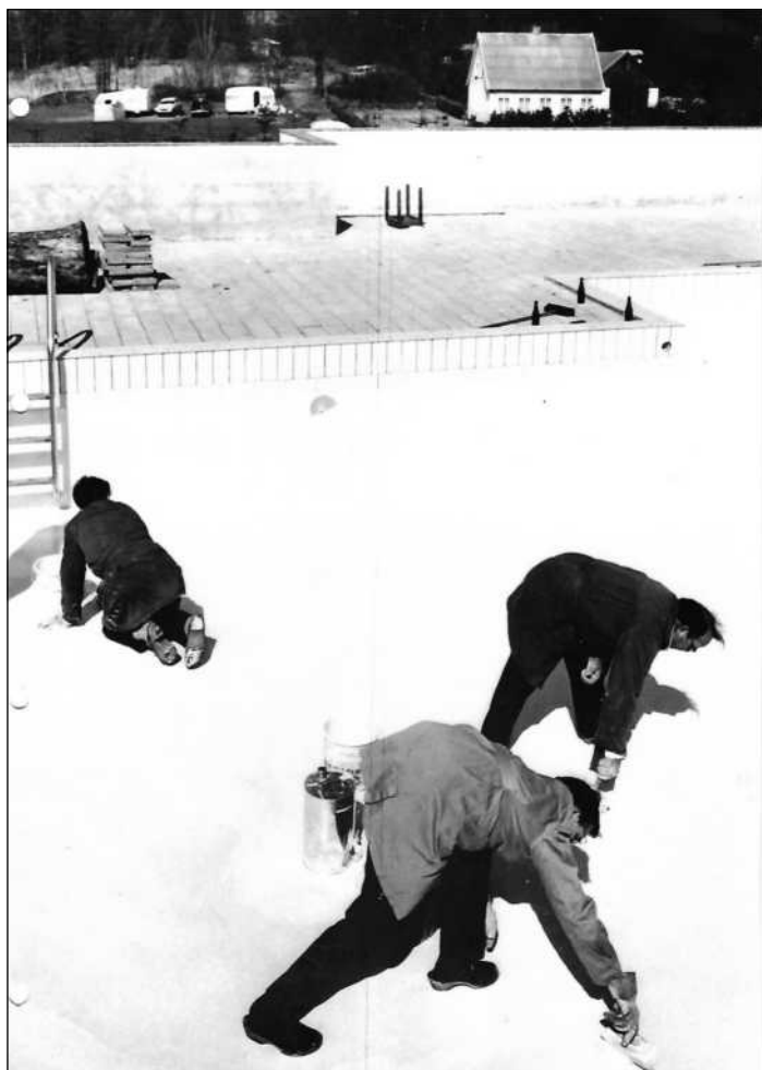
Svømmebassin bliver til, 1970