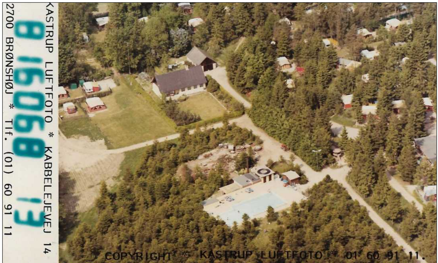
Luft foto Højbodavej 35 fra ca. 1984.