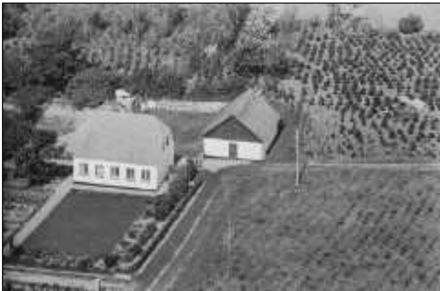
Højbodavej nr. 35 Foto fra 1949