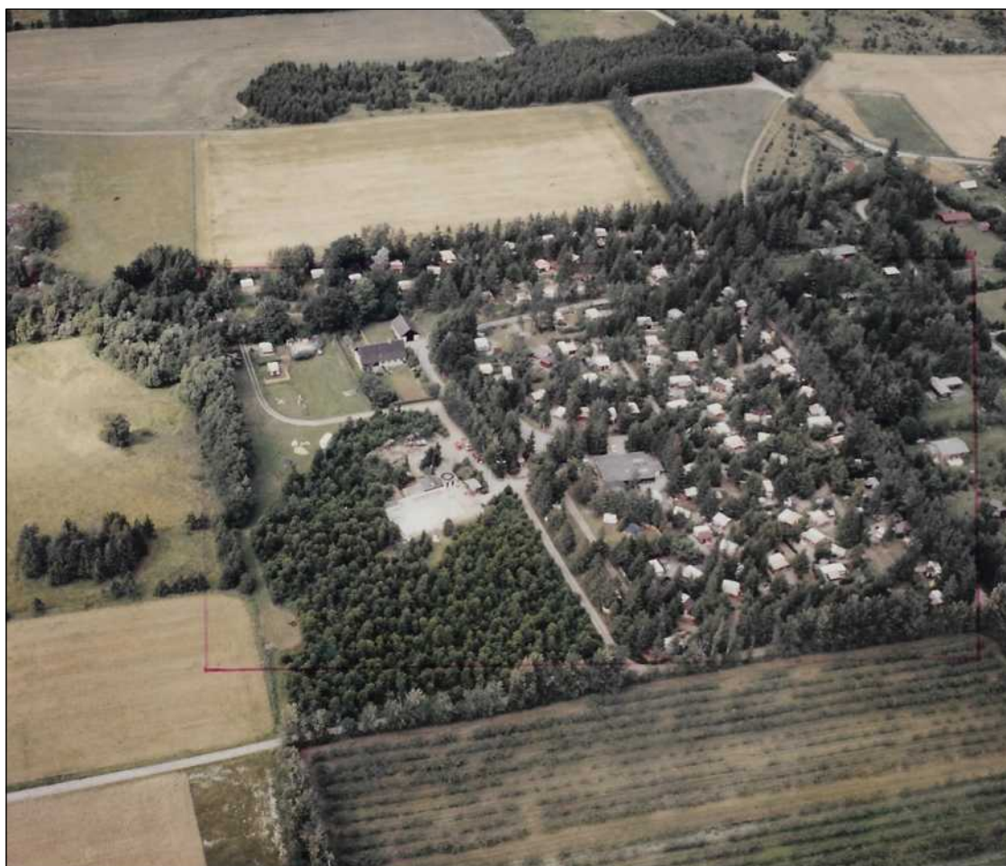
Assentorp camping 1984