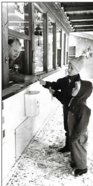
Så bliver der handlet i kiosken. Der er altid lidt mundgodt som børnene kan købe.

Over alt hersker der glæde og tilfredshed, det er stort set de samme mennesker der kommer uge efter uge. Tilbringer deres ferie hvert år på Assentorp campingplads. De nye der kommer til bliver som regel hurtigt faste beboere.