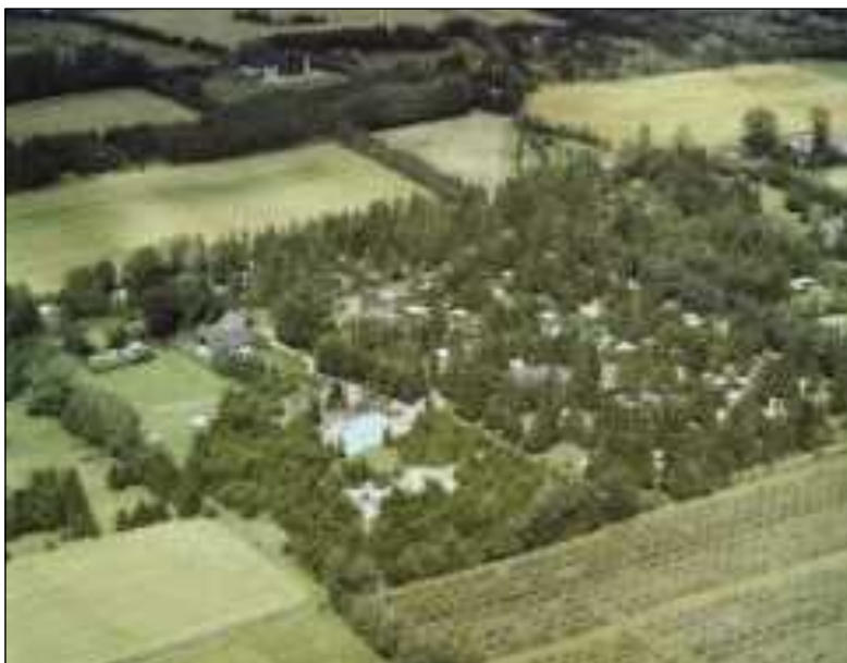
Højbodavej nr. 35 Foto fra 1987