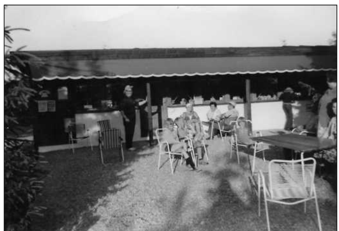
Hygge foran kiosken.