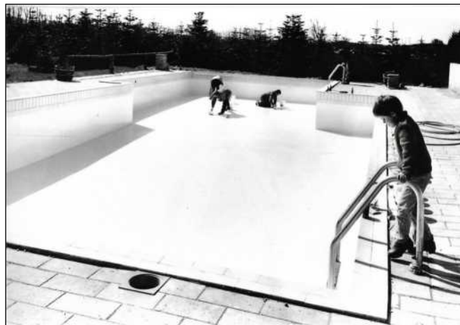
Svømmebad under udførelse i 1970

Svømmebadet som lavet i 1970 blev hurtigt et tilløbs stykke for campingpladsens teltliggere og omegnens beboere. Det kostede 100.000 kr. at få det installeret, først blev det opvarmet til 25 grader med oliefyr. I 1980 blev fyret skiftet ud med et brændefyr til stor besparelse, Poul fik sat kasser op til indsamling af pap, papir og andet brændbart til fyret.