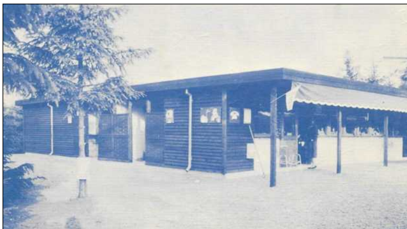
Den første bygning var bygget efter Sanduppernes campingplads i Vester Lyng.