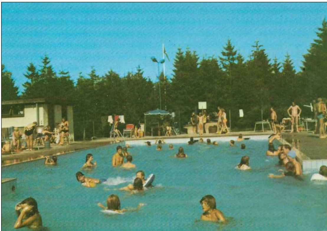
Svømmebadet på postkort 1970