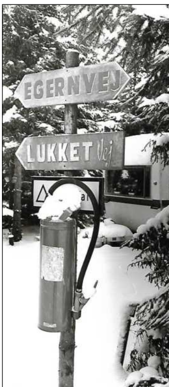
Teltgaderne er forsynet med flotte navneskilte, som en af pladsens beboere har lavet.

Udhus opført i 1999, feriehytte opført i 2003 og opholdsrum/billetsalg til svømmebad opført i 2008, stålbuehal opført i 2019.