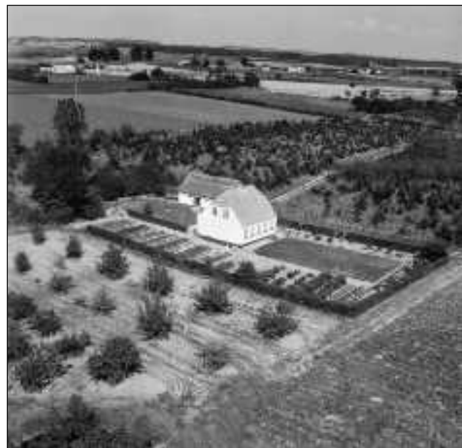
Højbodavej nr. 35 Foto fra 1955