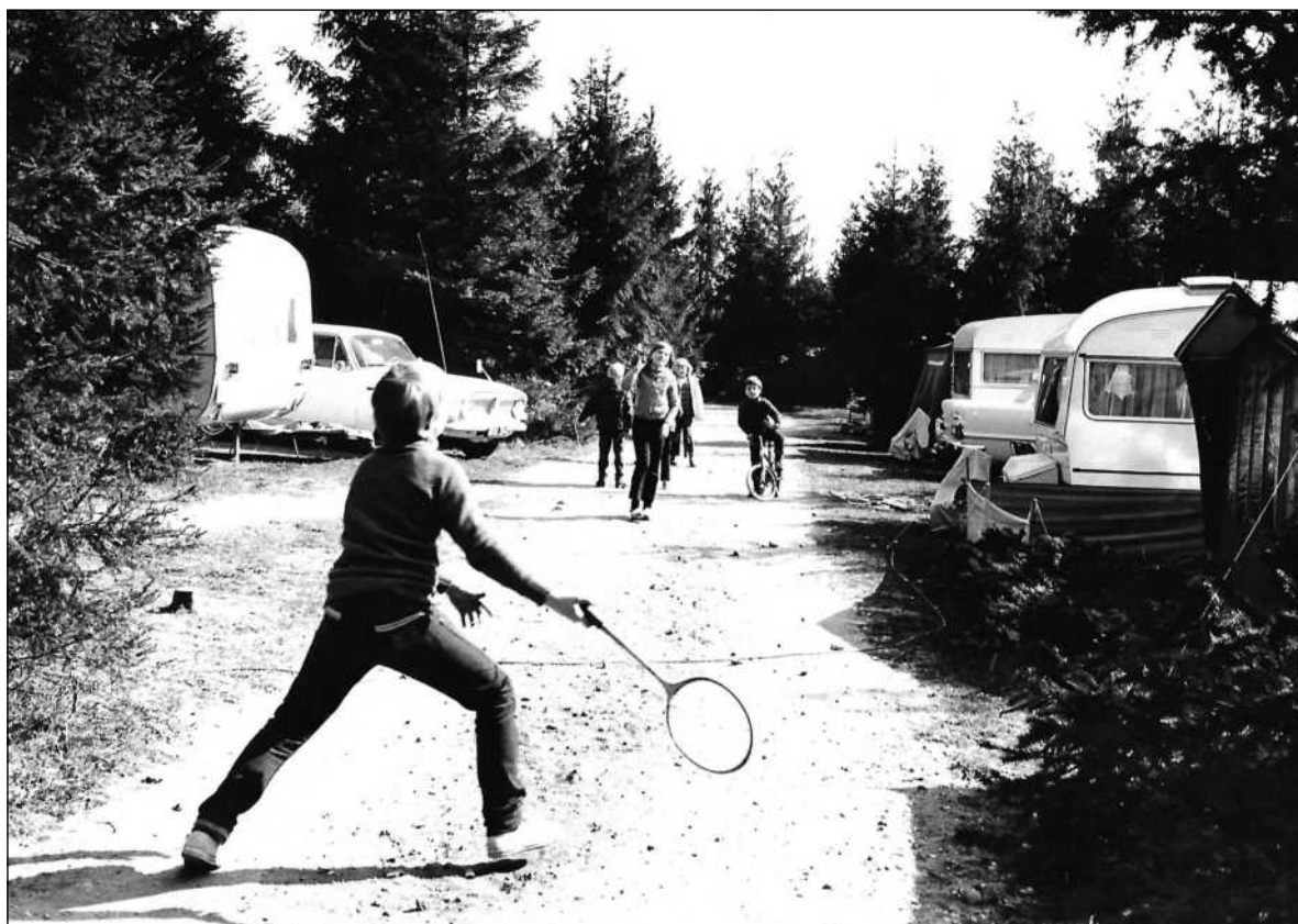
Leg i 1969