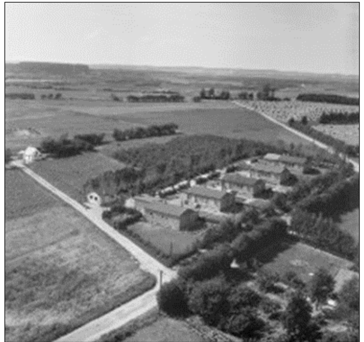
Birkehusene. Luftfoto fra 1955.