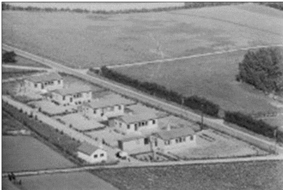
Luftfoto fra 1949. Husene ligger imellem Birkeallé og Assentorpvej. Bemærk det lille hus til venstre, det var fælles vaskehus. Senere blev det et kølehus og er i dag garage.

De blev sat på Birkegårdens jord Assentorpvej 131 matrikel 2a. og blev brugt til arbejdere, som arbejdede på Birkegårdens Briketfabrik. Husene blev senere solgt fra som ejerboliger. De var oprindelig træhuse, som senere er blevet pudset, i dag 2024 er der kun tre huse tilbage. Birke Allé nr. 6 er revet ned for en del år siden og nr. 8 brændte ned i november 2020 og er siden revet ned.